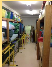
きれいに片付いた倉庫