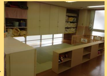
戸棚の下に潜り込める！奥は窓になっています⇒

頭をぶつけて危ないからと吊り戸棚の下は子どもが入れないようにしてしまいがちですが、当代島保育園ではこんなスペースもあえて遊び場に！一、二度ぶつけてしまうことはあっても、その後は気を付けて潜り込むそうです。